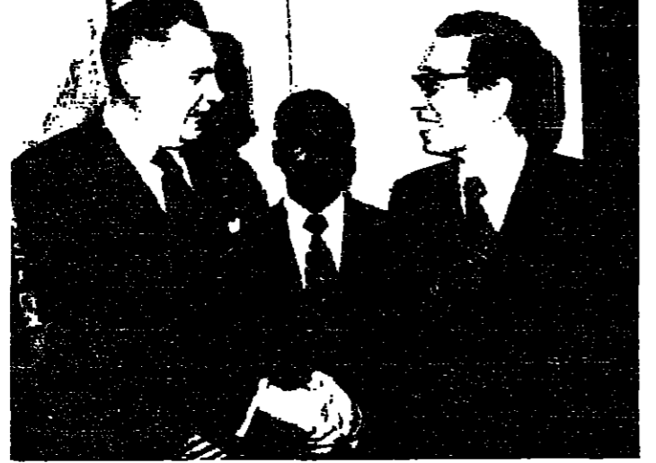
وزير الخارجية المصرية بالوكالة الدكتور غالي لدى استقباله السفير الإسرائيلي في القاهرة أمس